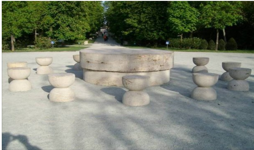
Masa Tăcerii de la Tg-Jiu, opera Sculptorului Constantin Brâncuși. Masa Tăcerii marchează centrul Imensei Piramide Energetice Primordiale

Ca o prezentare generală, pot spune că aveți 12 orașe din țară care au în subteran câte o Piramidă Energetică, restul de 12 Piramide fiind distribuite în munți, câmpii și podișuri. La timpul potrivit vă v-om oferi și alte detalii, dar acum sunt suficiente cele prezentate. (mesager Floare Bândariu).