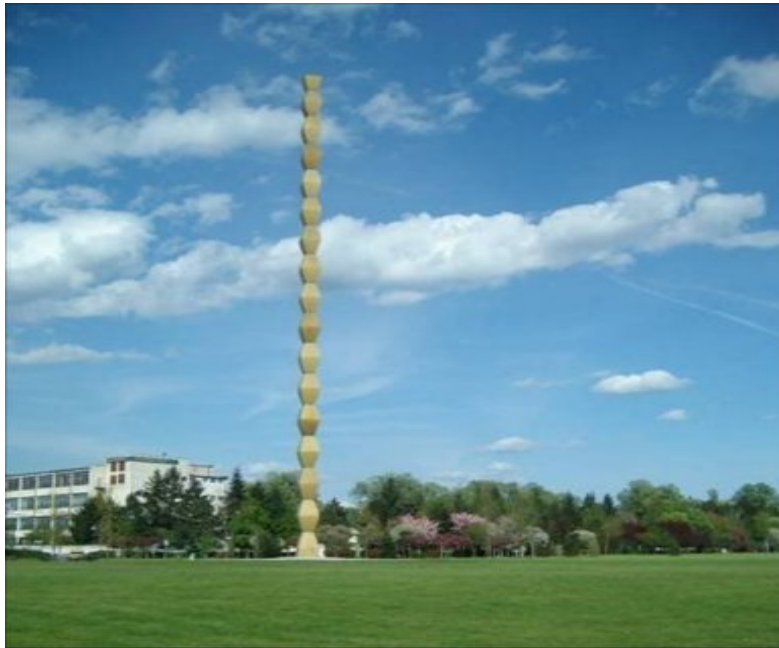
Coloana Infinitului de la Tg-Jiu. Lucrare a sculptorului Constantin Brâncuși. Coloana Infinitului este o coloană de module piramidale interconectate.

Întregul mesaj este scris cu litere chirilice (Posibil ca mesajul să fie scris de Ctitorul-Călugărul-Stareț NICODIM de la Mănăstirea Tismana, fiindcă El medita în Interiorul Muntelui lângă Piramidă). (Mesager Floare Bândariu).